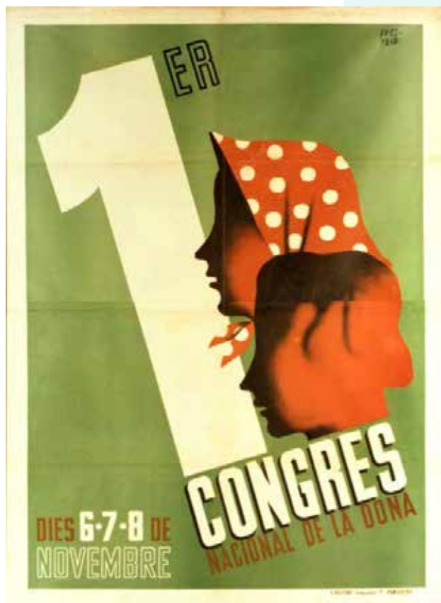
I Congrés Nacional de la Dona (1937)