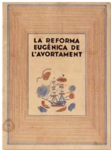
Reforma Eugènica de l'avortament, 1937, publicat al DOG. 9 gener 1937

Extret de Segura Soriano, Isabel, La lluita per l'oportunitat de viure . ICD