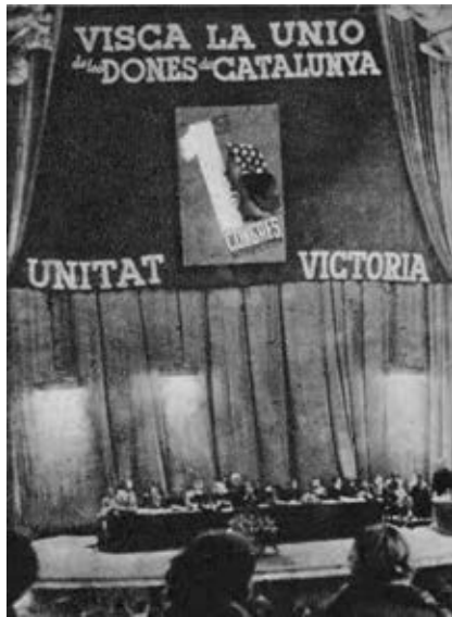
1 Congrés Nacional de la Dona