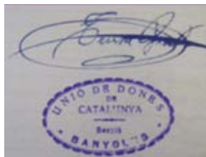
Segell de la Unió de Dones amb la