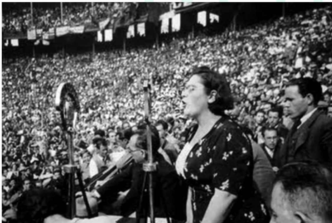
Frederica Montseny en un míting de la CNT a la plaça Monumental. Juliol de 1936.

aquests debats. Només una elit minoritària de dones, poc representativa de la societat, hi participava. El silenci de les dones en relació a l'avortament estava lligat a les restriccions de gènere i al predomini de valors patriarcals que associaven la identitat femenina a la maternitat i la domesticitat. Els debats van sorgir principalment per la preocupació sobre les elevades taxes de mortalitat associades a l'avortament.