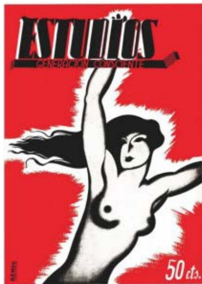
Portada de la revista Estudios.

El sexe no el vivien ni el gaudien, ni sabien què era el plaer. (...) Era estar a disposició de l'home, era aquest patró de funcionament."