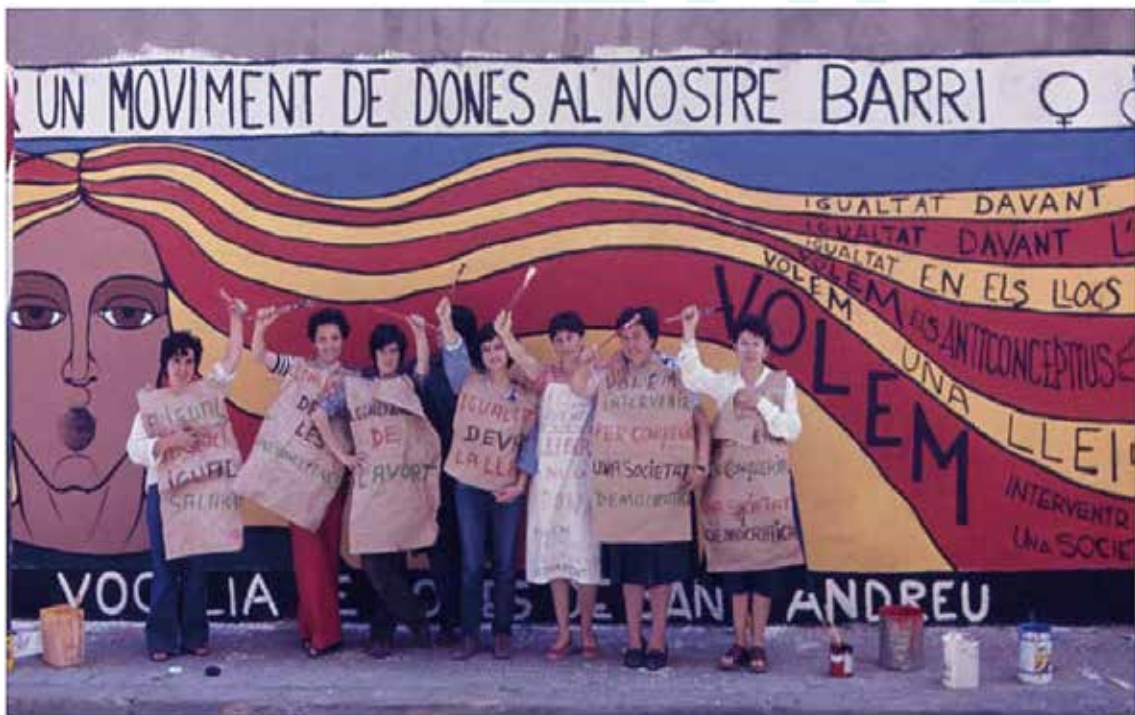
Vocalies de dones