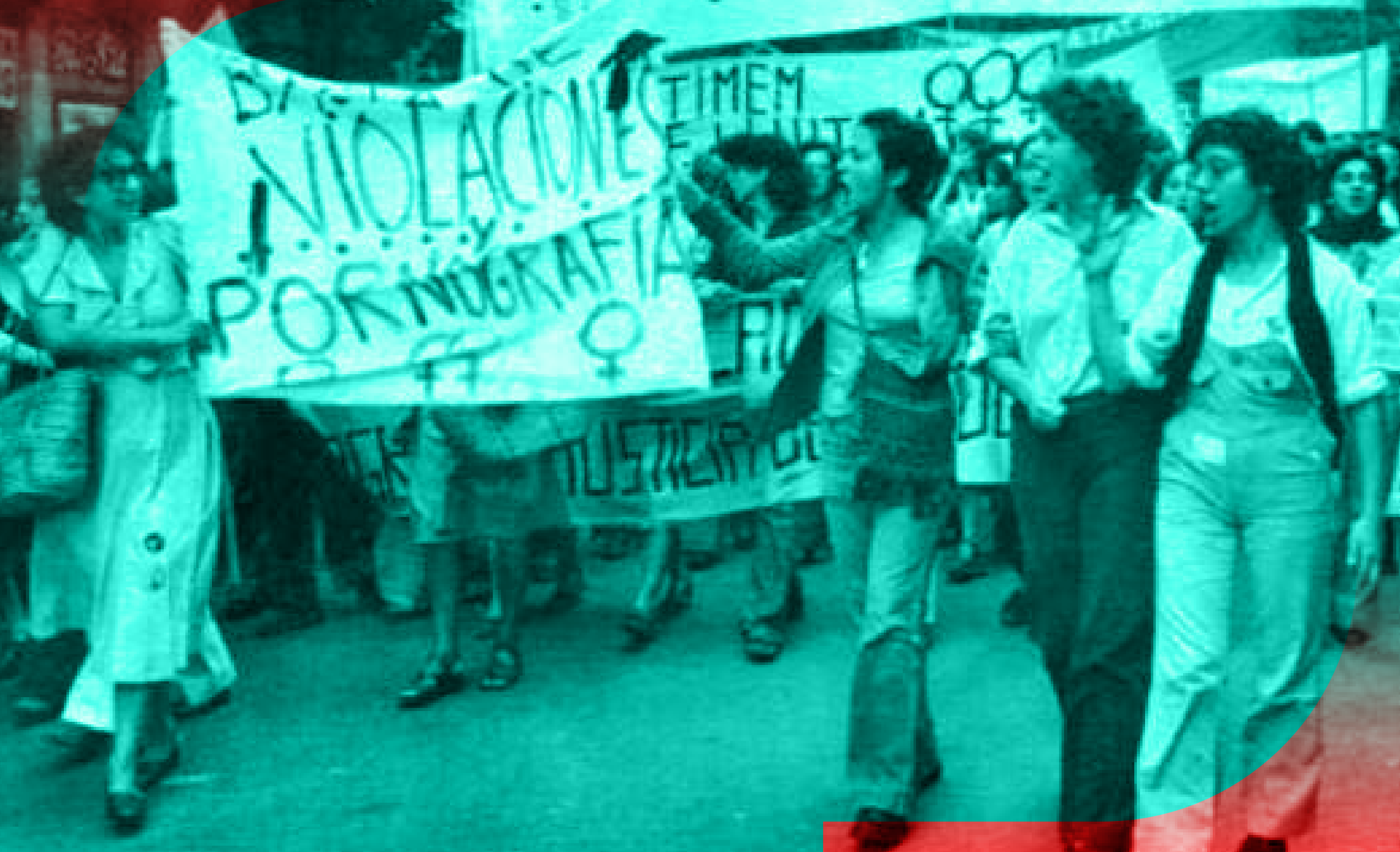
Foto: extret de Puigll, H. (2022). Del gris al violeta. El moviment feminista de la transició a Lleida: la part de la història que no s'ha explicat . Del gris al violeta