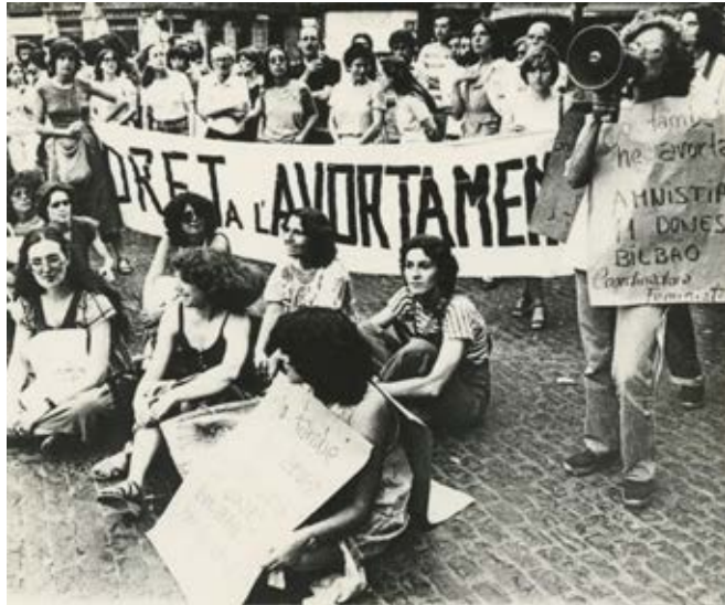
Manifestació pel dret a l'avortament, 1980. Arxiu gràfic revestisca Canigó, extret de Arxiu de la Democràcia de la Universitat d'Alacant

La idea de ser professionals i activistes era la que predominava”