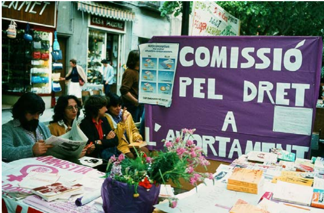
Parada informativa a la Rambla de Girona del Casal de la Dona