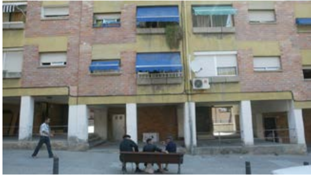
Foto d'arxiu del barri lleidatà de la Mariola

pas endavant en aquest procés. Arran de la transformació del Grup de Dones de Lleida en el Grup Feminista de Ponent, es va decidir crear una coordinadora de la vegueria de ponent, incorporant una àmplia varietat de participants, incloent-hi socialistes, membres d'Iniciativa per Catalunya, les secretaries de la dona d'UGT i CCOO, dones independents i membres del Grup de Dones de Lleida. La creació de la Coordinadora, ja de caràcter més institucionalitzat, va ser un reflex d'aquest procés general, on les demandes feministes es van començar a canalitzar a través de les institucions, perdent part de la seva autoorganització i radicalitat original.