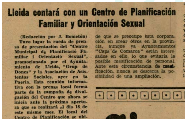
Notícia sobre la creació del Centre de Planificació Familiar a Lleida

de que se preocupe esta corporación en crear otros en la provincia, aunque ya Ayuntamientos "Caps de Comarca" están interesados en ello, lo que evitaría la posible masificación de personal. Ante esta circunstancia de masificación, nunca se descarta la posibilidad de una ampliación.