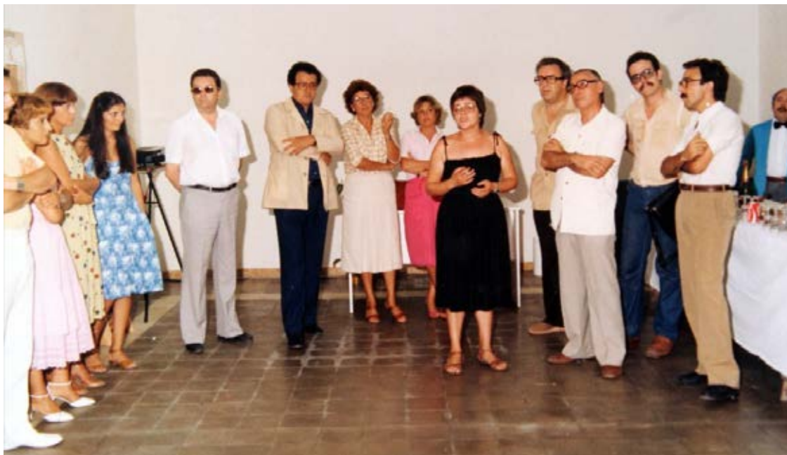
Inauguració del CPF mitja lluna

Font: Chinchilla, 31 de juliol de 1981. Centre d'Imatges de Tarragona / L'Arxiu