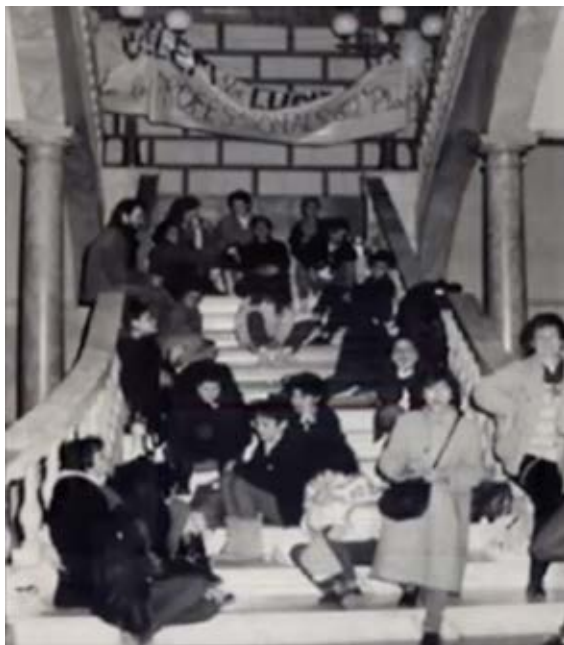
Protesta pel tancament del CPF Mitja Lluna