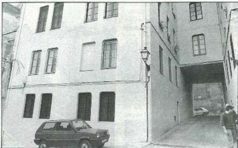
Edifici on s'ubicarà la Casa d'Acollida per a dones maltractades.