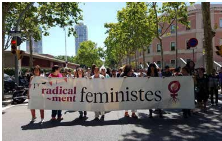
Pancarta de les Jornades Radical-ment feministes de 2016