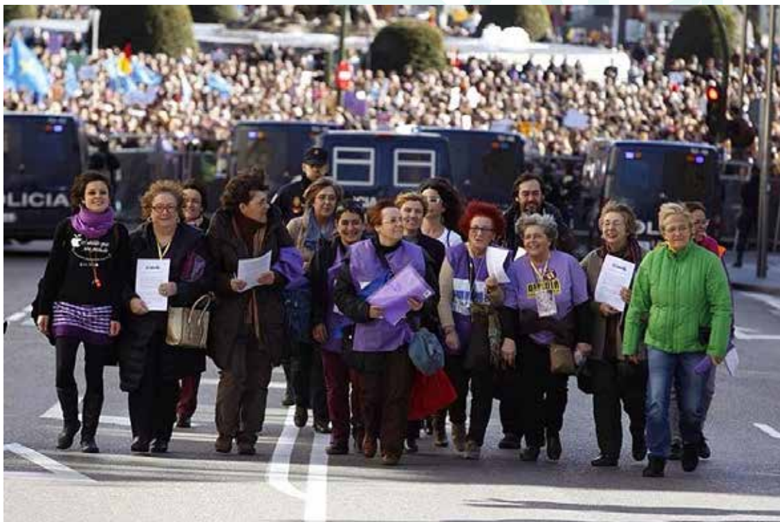
Tren de la Llibertat