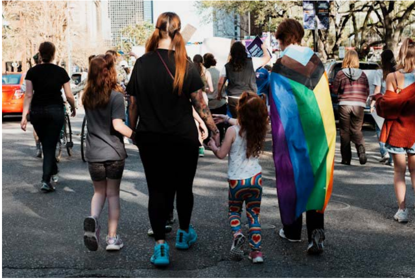
Manifestació pels drets de les persones LGTBIQ+