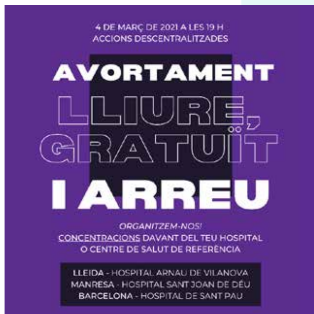
Cartell de les manifestacions descentralitzades per un avortament lliure i gratuït